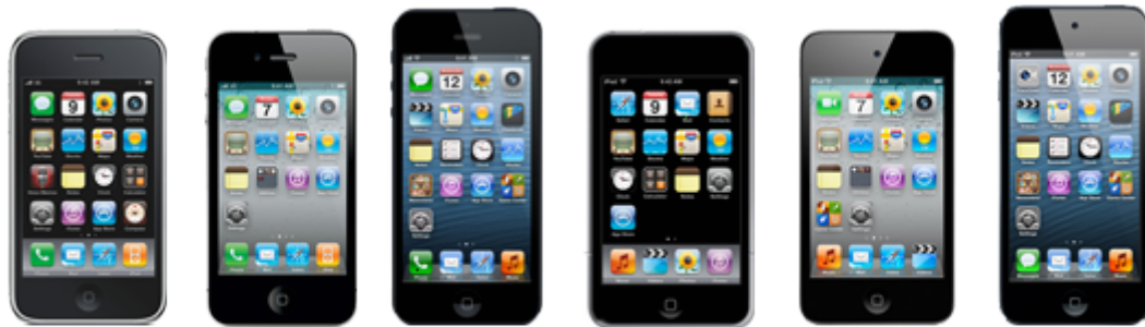
iPhone 3G/3GS iPhone 4G/4GS iPhone 5 Touch 2G/3G Touch 4G Touch 5G