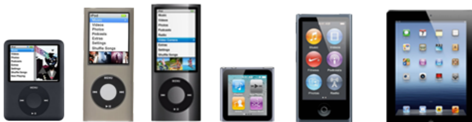
Nano 3G Nano 4G Nano 5G Nano 6G Nano 7G iPad 1/2/3